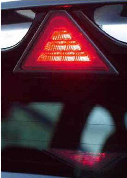
Der schwarzglänzende Heckspoiler verfügt über ein integriertes dreieckiges Bremslicht für mehr Stil, verbesserte Aerodynamik und bessere Sichtbarkeit.

Eines der markantesten Features ist das Rev Matching, das durch automatische Erhöhung der Motordrehzahl beim Schalten in einen niedrigeren Gang für einen reibungslosen, sportlichen Gangwechsel sorgt. Ebenfalls serienmäßig ist die Launch Control: Für einen optimalen Start sorgt sie beim Anfahren aus dem Stand für maximale Kraft auf die Antriebsräder bei minimalem Schlupf. Die High-Performance-Daten des 8-Zoll-Touchscreens, integriert im Navigationssystem, geben detaillierte Auskunft (G-Kräfte, Drehmoment und Rundenzeiten) – damit können Sie Ihren Fahrstil genau analysieren.