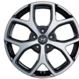
18 Zoll Leichtmetallfelge