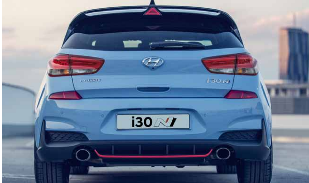
Die Sportabgasanlage mit zwei Endrohren verstärkt die auffällige Ästhetik dieses Kompaktsportlers und trägt zum unverwechselbaren Sound des Hyundai i30 N bei.