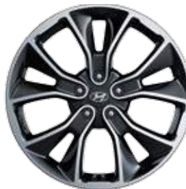
19 Zoll Leichtmetallfelge