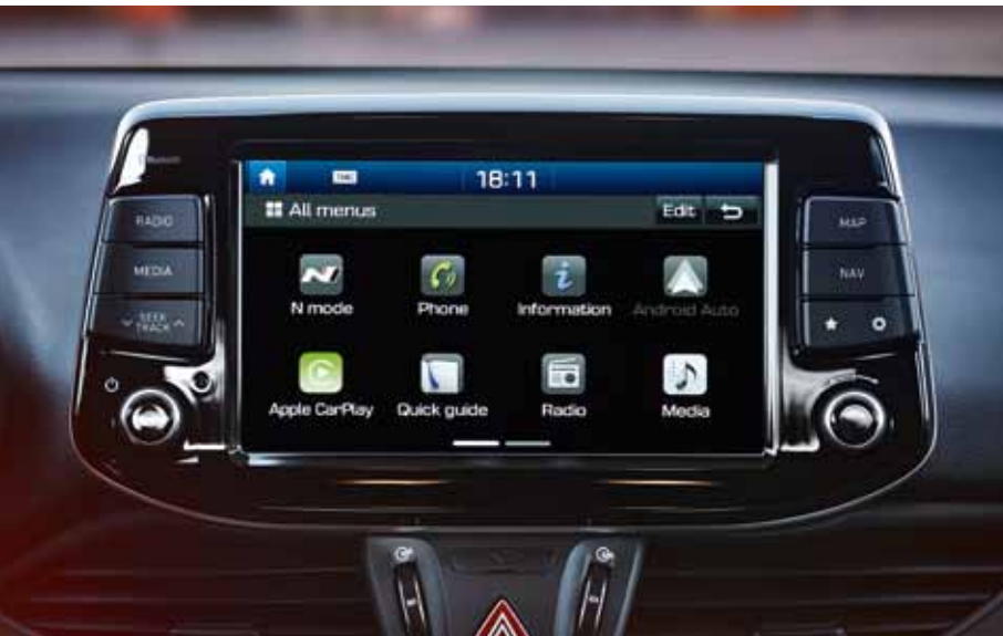
Navigationssystem mit 8-Zoll-Farbdisplay.

Apple CarPlay™ ist eine eingetragene Marke von Apple Inc., Android Auto™ ist eine eingetragene Marke von Google Inc.