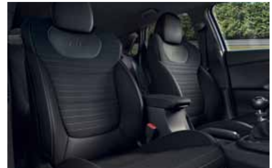
Veloursleder/Leder 1) schwarz

Österreichmodelle gemäß aktueller Preisliste