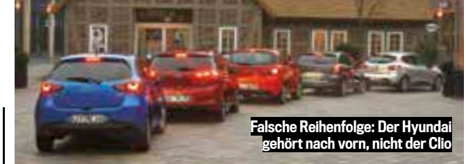
Falsche Reihenfolge: Der Hyundai gehört nach vorn, nicht der Clio

Geräumig, mit viel Komfort und kompletter Ausstattung. Sattede Garantie. | Ausgewogen, mit feinem Motor und souveränem Fahrwerk. | Merklich gereift, mit schönem Fahrwerk und ordentlich Platz. | Leicht, agil, sparsam und damit sehr modern. Fond ziemlich eng. | Hat Charme und einen modernen Motor. Aber wenig Platz und Komfort.