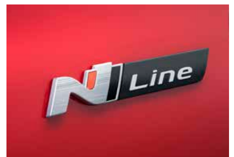
N-Line Emblem auf den vorderen Kotflügeln

Mit den neuen Ausstattungslinien N-Line und N-Line Plus erhält der Hyundai i30 5-Türer echte Rennsportgene: Sportliche Designelemente im Stil unseres erfolgreichen Hochleistungsfahrzeugs i30 N sowie eine Extraportion Dynamik bei Bremsen, Reifen und Fahrwerk. So wird jede Alltagsfahrt zum besonderen Erlebnis.