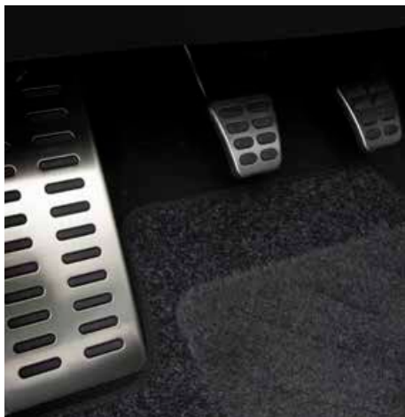
Sportpedale in Aluminiumoptik