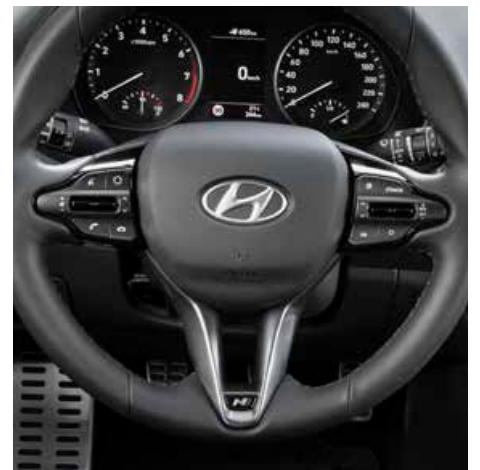
N-Line Sportlenkrad mit N Logo