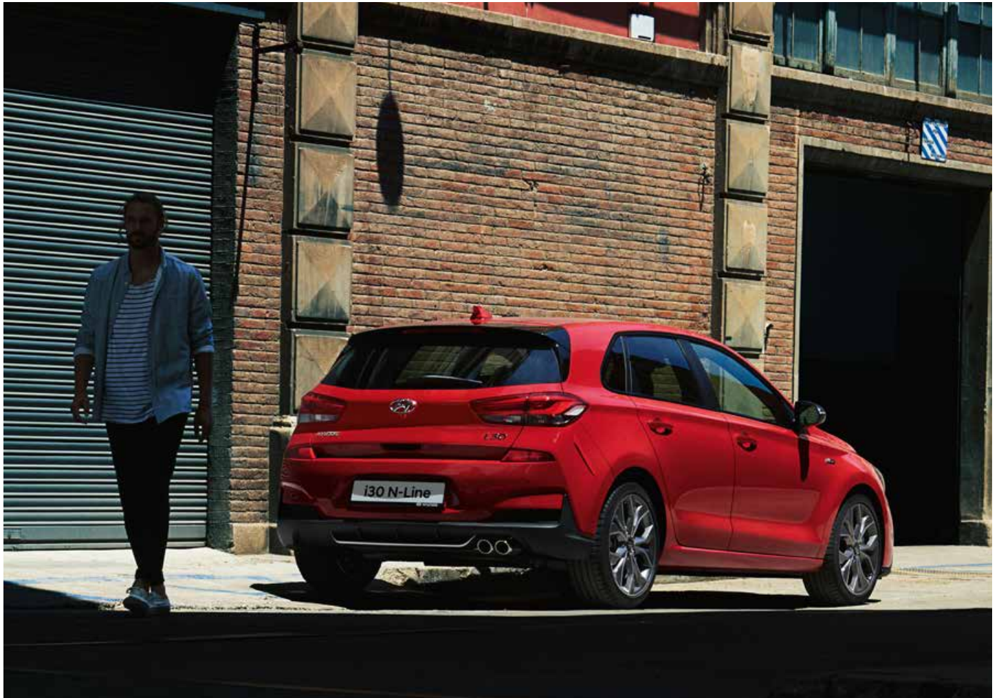
Heckschürze mit integriertem Diffusor und silberner Zierleiste

Eine Fülle exklusiver Designdetails lässt an den N-Genen dieses Hyundai i30 keine Zweifel: Neben der markanten Front- und Heckschürze, runden Applikationen mit dem N Logo auf dem Sportlenkrad und dem Schaltknäuf im Innenraum sowie die Sportsitze aus dem i30 N das Paket ab. Für ein dynamisches Fahrverhalten sorgen ein optimiertes Fahrwerk inklusive größere Bremsanlage vorne. Daher steht der i30 N-Line und N-Line Plus für noch mehr Agilität und Fahrspaß!