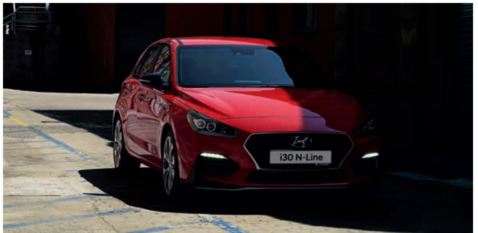
Frontlippe in Schwarz mit silberner Zierleiste