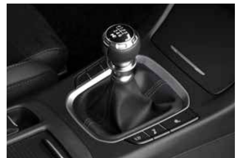
N-Line Lederschaltknauf mit Chromumrandung und N Logo