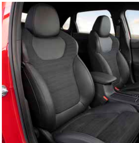
N-Line Plus Sportsitze Veloursleder/Leder 6)